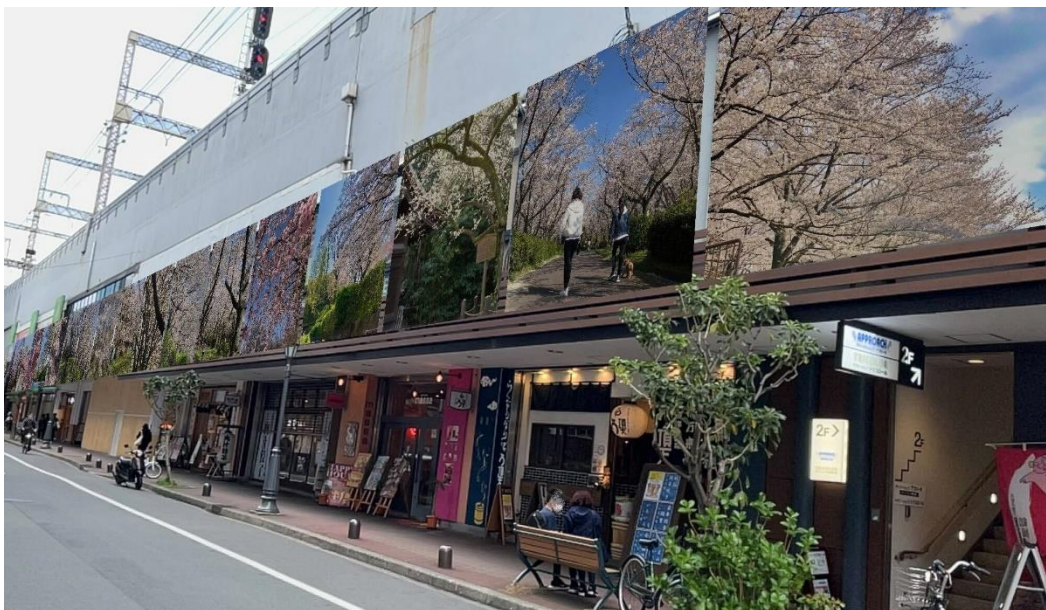
(画像はイメージです)

また、4月1日(土)から4月20日(木)の期間、京橋駅周辺エリアで本企画のARアートを閲覧、アプリ内で撮影したARアートの写真をSNSに投稿することでプレゼントが当たるキャンペーンも実施します。