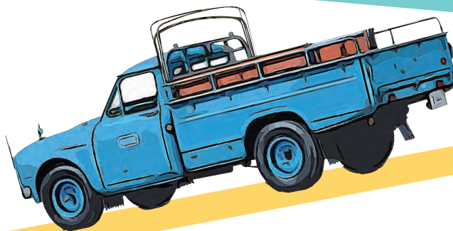
トヨペット スタウト RK35型 (1959年)