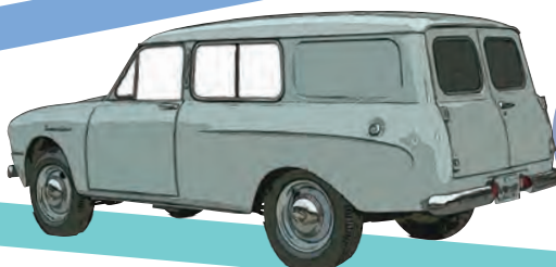
トヨペット マスターライン ライトバン RR17型 (1956年)