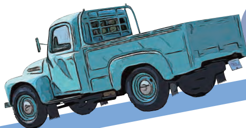
トヨペット トラック SG型 (1953年)