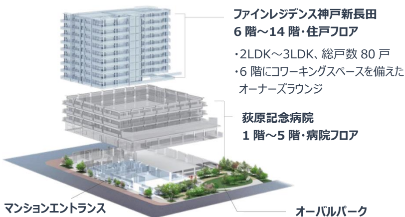
複合施設「ASMACI 神戸新長田」イメージ

敷地内広場「オーバルパーク」は、健康増進や防災減災をテーマとするイベントを開催して地域の交流拠点として活用するほか、災害時には地域の避難場所として被災者の暮らしを支える予定です。