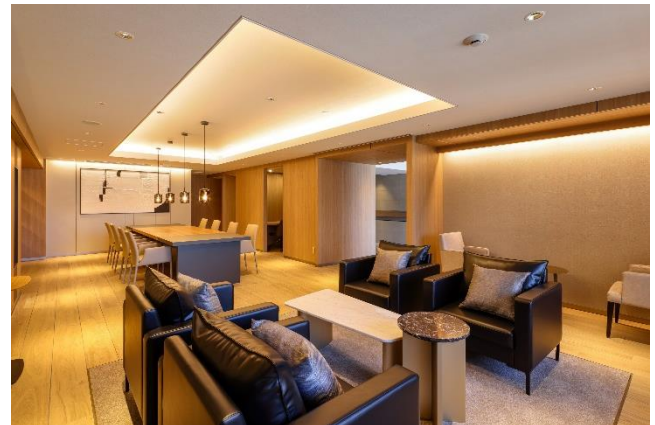
ワーキングスペースを備えたオーナーズラウンジ