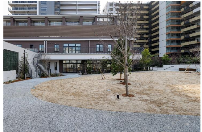
交流の場になるオーバルパーク