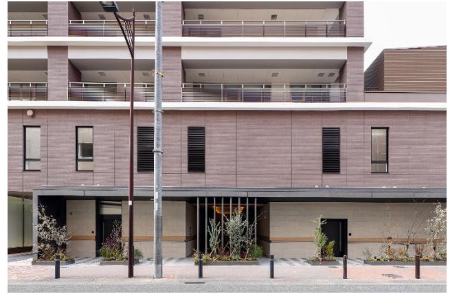
東側、マンションのエントランスアプローチ