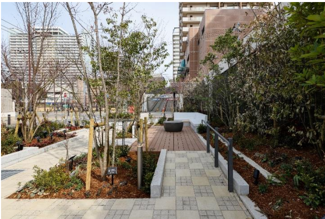
北側、オーバルパークに隣接するガーデンテラス