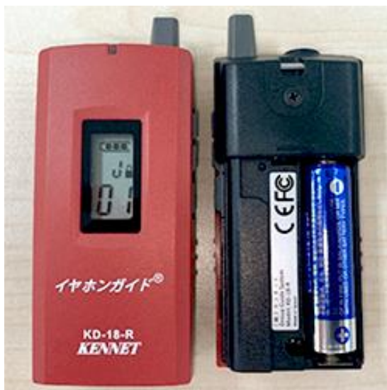
イヤホンガイドで使用している単三乾電池

EV市場拡大を背景としたリチウムイオン電池価格の高騰もあり、安価なアルカリ乾電池の利用が見直されていますが、その価格も上昇傾向にあります。昨今、SDGsへの取り組みが注目される中、当社は事業活動と寄贈活動を通じて、SDGs目標達成に向けて取り組んでまいります。