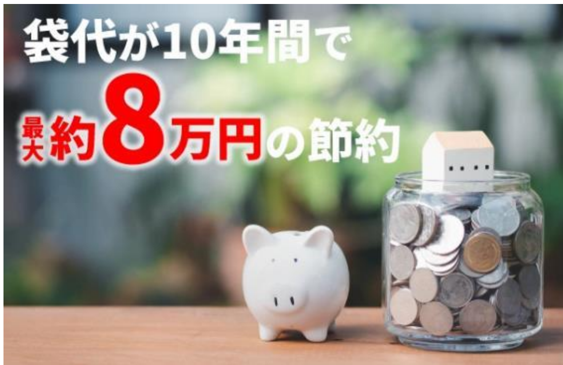
ゴミ袋 8万円分を節約

今までの3袋分が1袋にまとまるので、年間70回分のゴミ袋代は、自治体によって年間2,100円～8,400円ほどの節約になり、10年では21,000円～84,000円の節約になります。