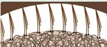
からんだ髪は頭皮にはりついています。

ブラシの面全体が頭皮に当たったことを感じたら、ブラシを左右に動かします。その時、ピンが髪の根元をほぐしているのを感じてください。