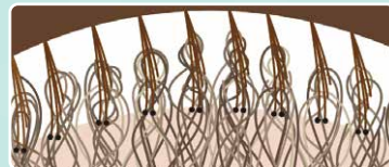
ほぐれた髪が浮き上がってきます。