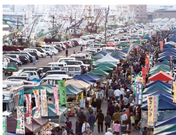
館鼻岸壁朝市 / 青森県