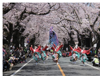
夜ノ森の桜 / 福島県