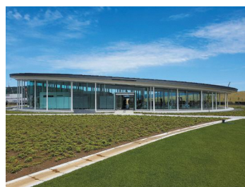
みやぎ東日本大震災津波伝承館 / 宮城県