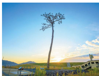
奇跡の一本松 / 岩手県