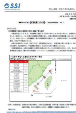
契約者向けレポート見本