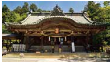
イザナギノミコト イザナミノミコト

筑波山をご神体と仰ぎ、伊弉諾尊と伊弉冊尊を祀る。夫婦神二神が祀られていることから、縁結び・夫婦和合・子授け・家内安全などに御利益があるといわれている。