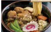
〈筑波山名物つくばうどん〉