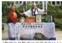
〈筑波山名物ガマの油売り口上〉