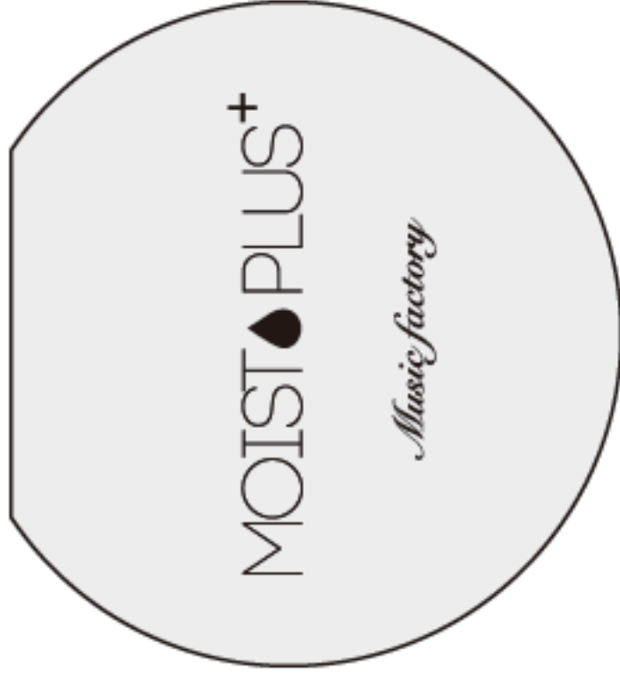
調湿プロテクター (シリコン部) 寸法図