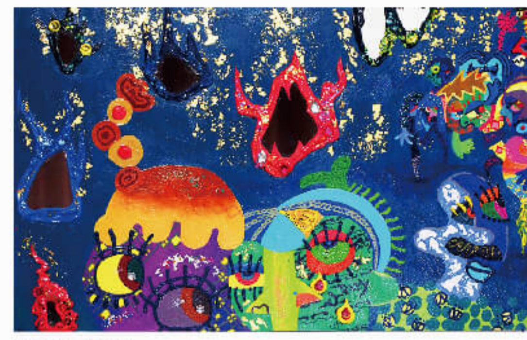
カズリ D 6F KAZURI