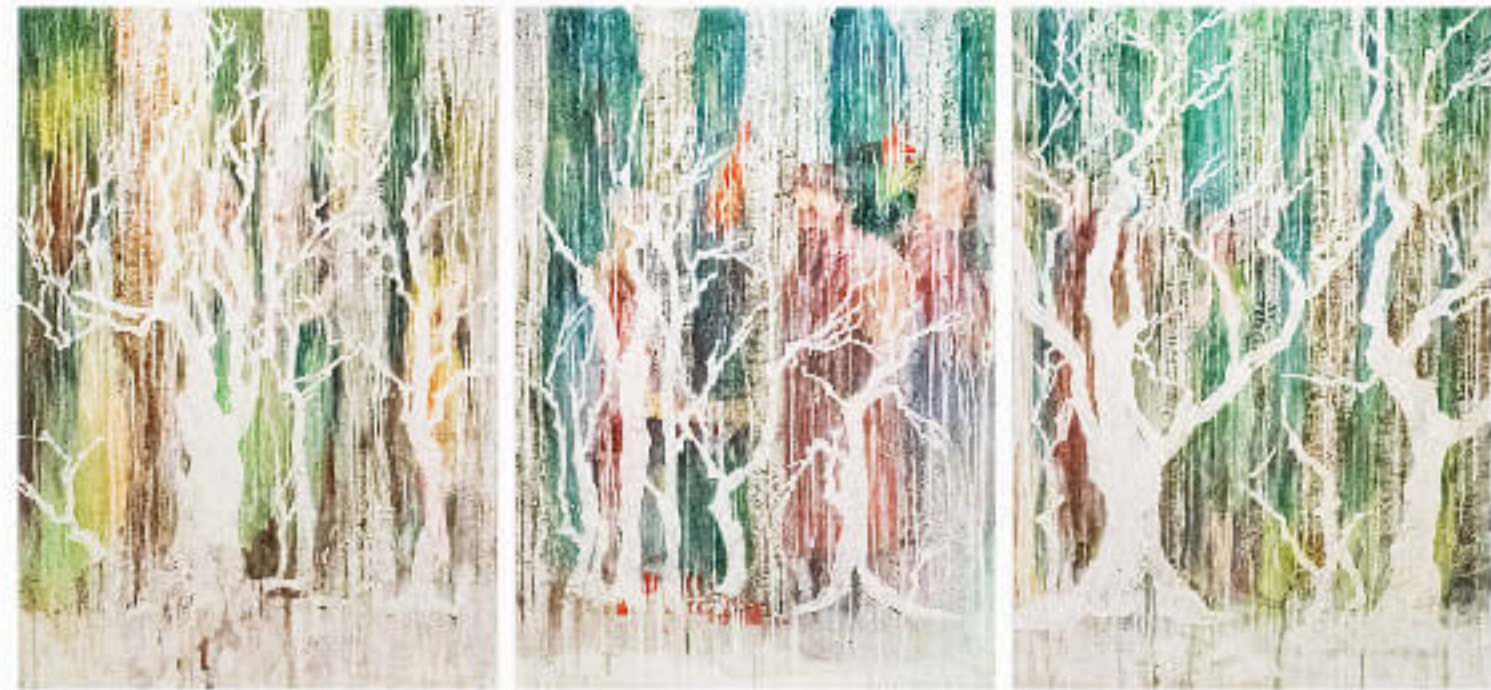
石原 葉 A Ishihara Yo