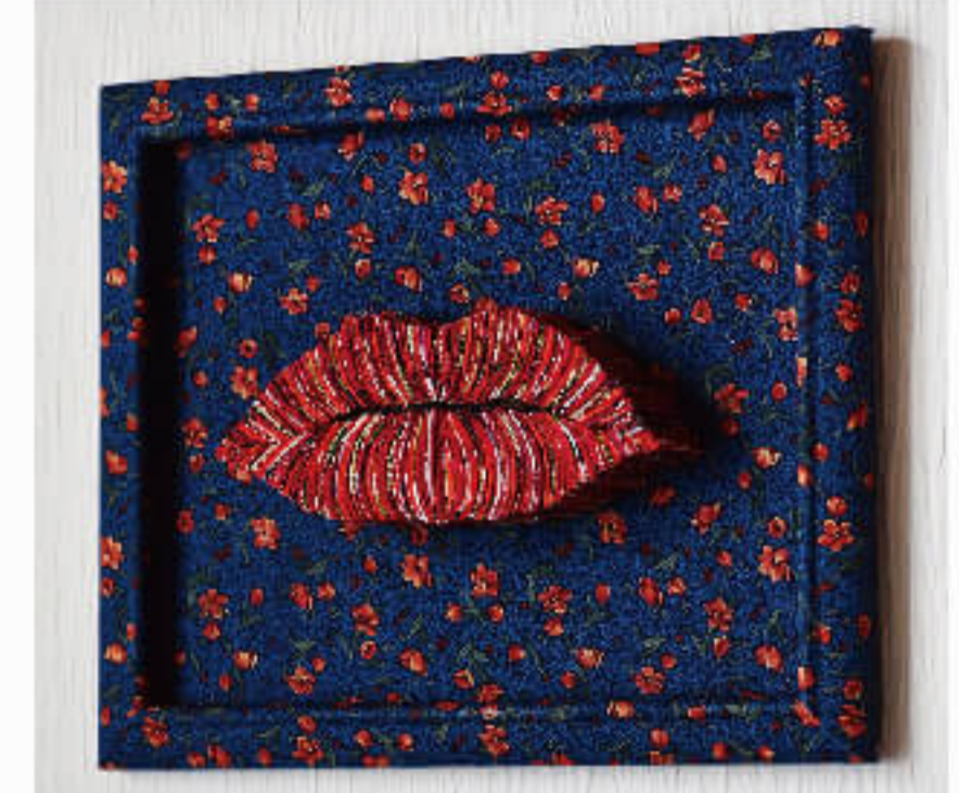
山本 圭子 B Yamamoto Keiko