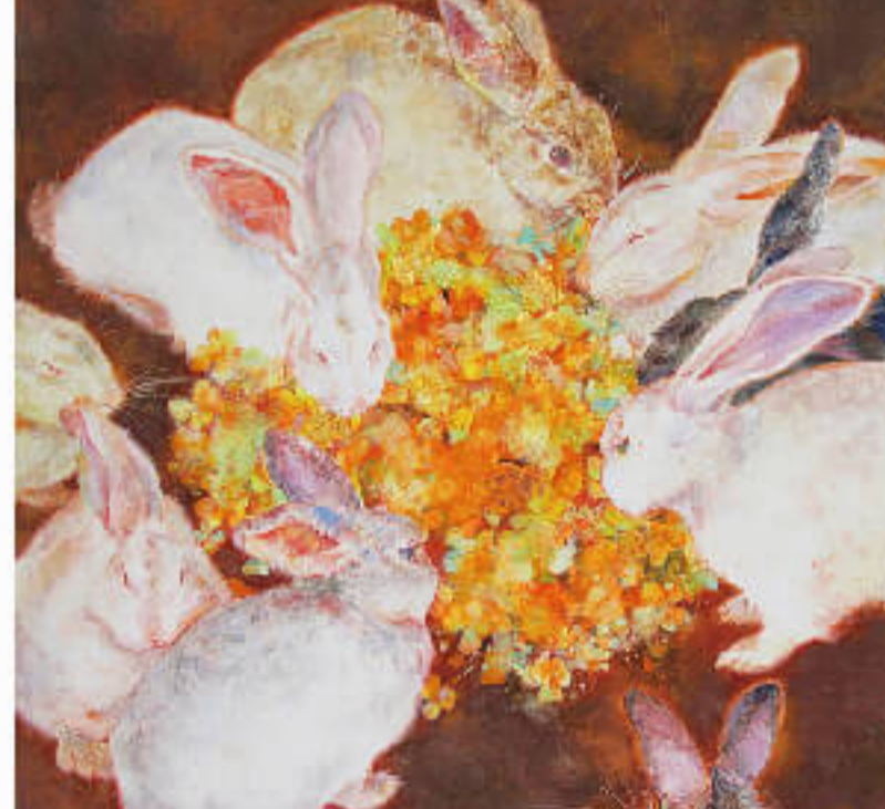
藤本 桃子 B Fujimoto Momoko