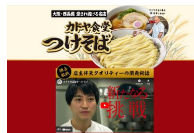
特設サイトトップページ

https://www.kinrei.com/ramen/nowater/kadoya-tsukesoba.html