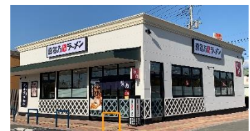
喜多方ラーメン坂内（石岡店）