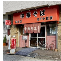
カドヤ食堂総本店