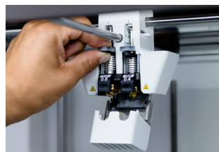
Print Core CC ガラスや炭素繊維の研磨複合材プリントを可能にするルビーチップ。 対応サイズ: 0.4 / 0.6 mm