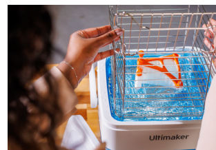
PVA Removal Station 水溶性PVAサポート材料を最大4倍速く除去