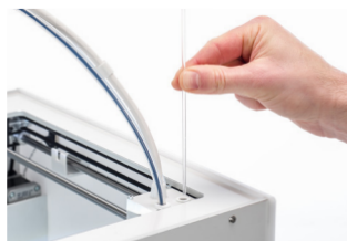
クリーニングフィラメント UltiMaker print coreを最適な状態に保つのに最適です