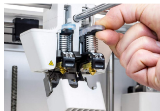
Print Core BB 成果物および水溶性サポート材料用のクイック交換ノズル。 対応サイズ: 0.25 / 0.4 / 0.8 mm