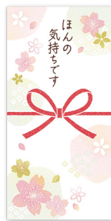
桜花 品番 22-5002 JANコード 4974268 153579