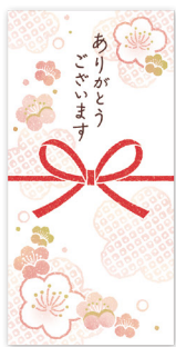
梅乃花 品番 22-5000 JANコード 4974268 153555