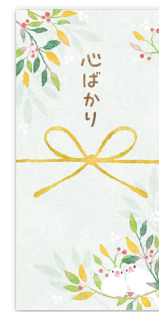
グリーン 品番 22-5005 JANコード 4974268 153609