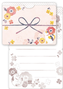
ガーデン 品番 22-5103 JANコード 4974268 153647