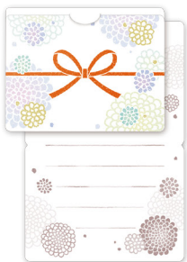
手毬菊 品番 22-5101 JANコード 4974268 153623