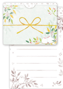
グリーン 品番 22-5105 JANコード 4974268 153661

●貼る面の汚れはよく拭き取ってから貼ってください。●貼る面の材質や形、状況によっては、うまく貼れないことや、のりの跡が残ることがあります。●長時間のご使用により、変色やのりが残ったり、貼付面の印刷などが剥がれる恐れがあります。●火気のある場所、直射日光が当たる場所、高温・多湿の場所での使用・保管を避けてください。●粘着面に手を触れたり、貼り直しをすると粘着力が低下します。●舐めたり、肌に貼ったりしないでください。●幼児の手の届かないところに保管してください。