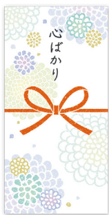
手毬菊 品番 22-5001 JANコード 4974268 153562