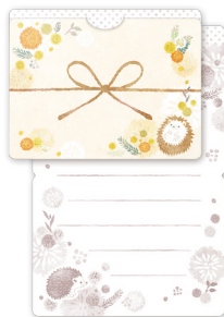
ミモザ 品番 22-5104 JANコード 4974268 153654