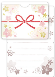
桜花 品番 22-5102 JANコード 4974268 153630