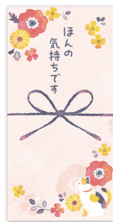
ガーデン 品番 22-5003 JANコード 4974268 153586