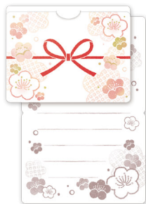
梅乃花 品番 22-5100 JANコード 4974268 153616