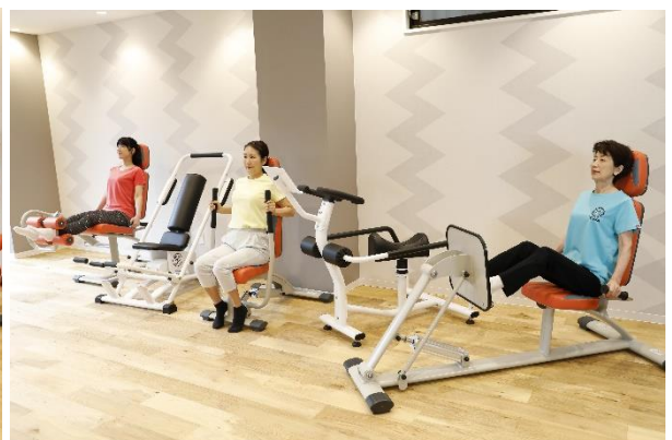
「WIND GARDEN 仙川」マシン運動(イメージ 2)