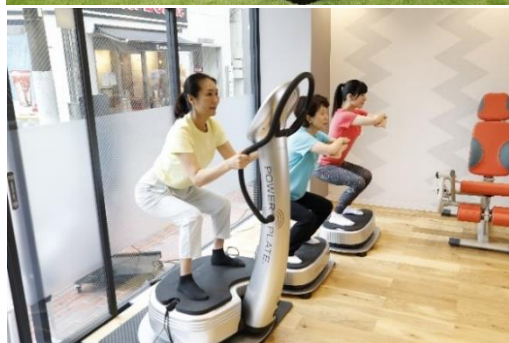
「WIND GARDEN 仙川」レッスン(イメージ)