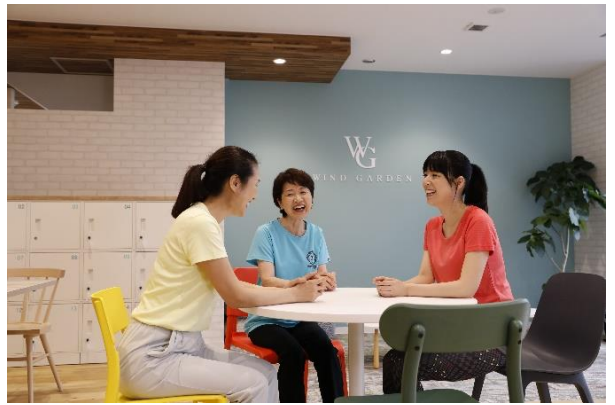
「WIND GARDEN 仙川」カフェスペース(イメージ)