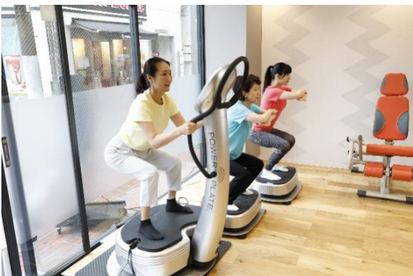
「WIND GARDEN 仙川」マシン運動(イメージ 1)