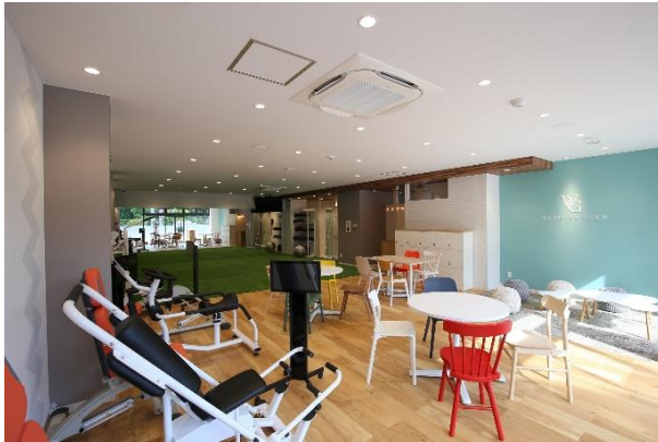
「WIND GARDEN 仙川」スタジオ内観(1)