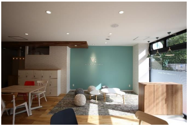
「WIND GARDEN 仙川」スタジオ内観(2)