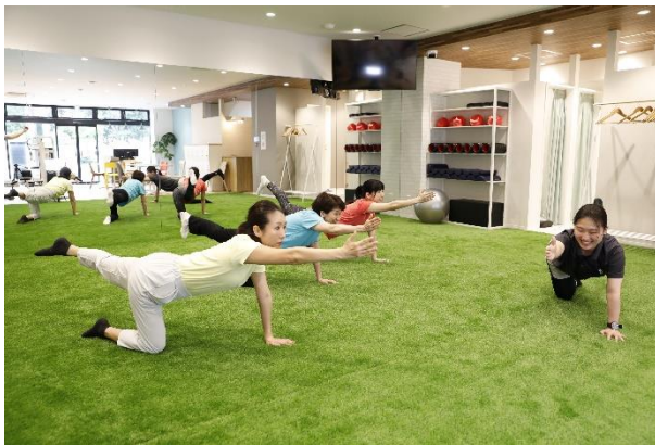
「WIND GARDEN 仙川」レッスン(イメージ)