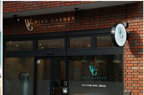
「WIND GARDEN 仙川」外観