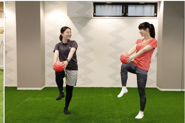
「WIND GARDEN 仙川」個人指導(イメージ)