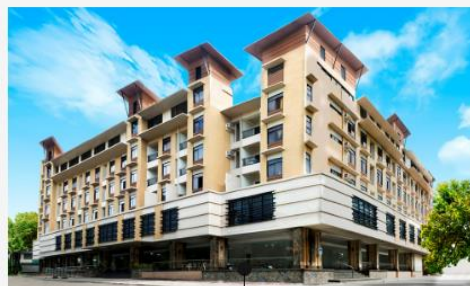
SMEAG - Capital Campus