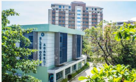
Cebu Blue Ocean Academy

https://global-click.jp/works/cebu-blue-ocean-academy/