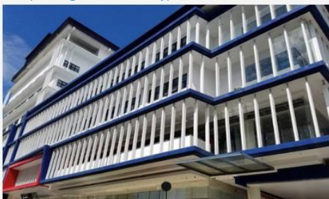
Cella - Uni Campus