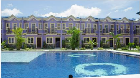
CG Academy - Sparta Campus

https://global-click.jp/works/cg-academy-2/