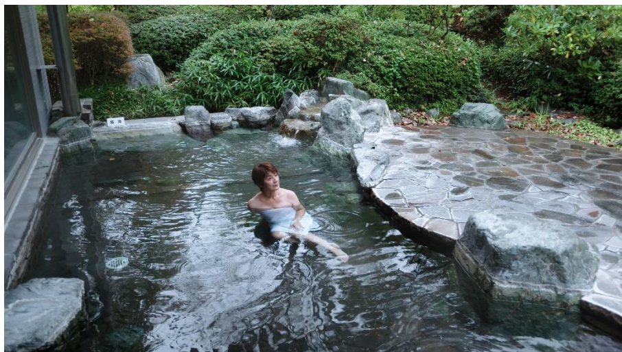
斎藤ホテル 露天風呂

湯は無色透明で、弱アルカリ性低張性高温泉。多くの人に受け入れられるなめらかでクセがなく、湯上がり後も温かさが持続すると好評です。この温泉があったからこそ古くは湯治場として栄え、1956年には国民保養地として認定されました。