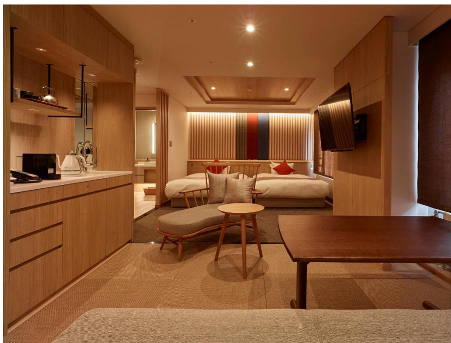
客室 溪 Bタイプ

齋藤ホテル 10F を大胆にリニューアルしたプレミアムフロア。“セカンドホーム”のように自由にリゾートライフを過ごしていただこうと、内装には上田市の伝統工芸・上田紬をアクセントに、使い勝手とデザイン性を備えた木製家具を配しました。ワイングラスなどの食器も用意されているので、旅先で買ったワインを客室で楽しむこともできます。