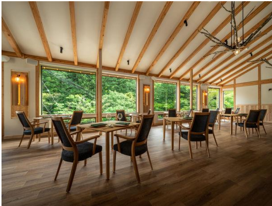
Restaurant 溪 内観