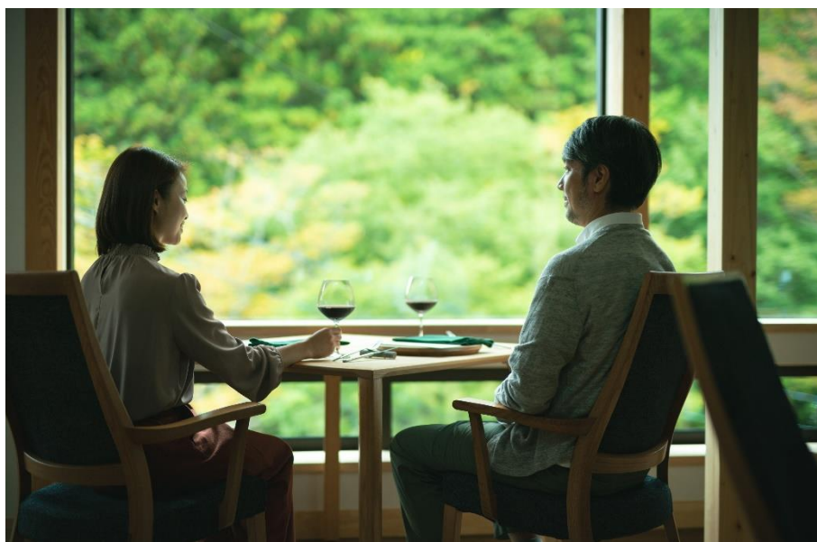
Restaurant 溪 内観