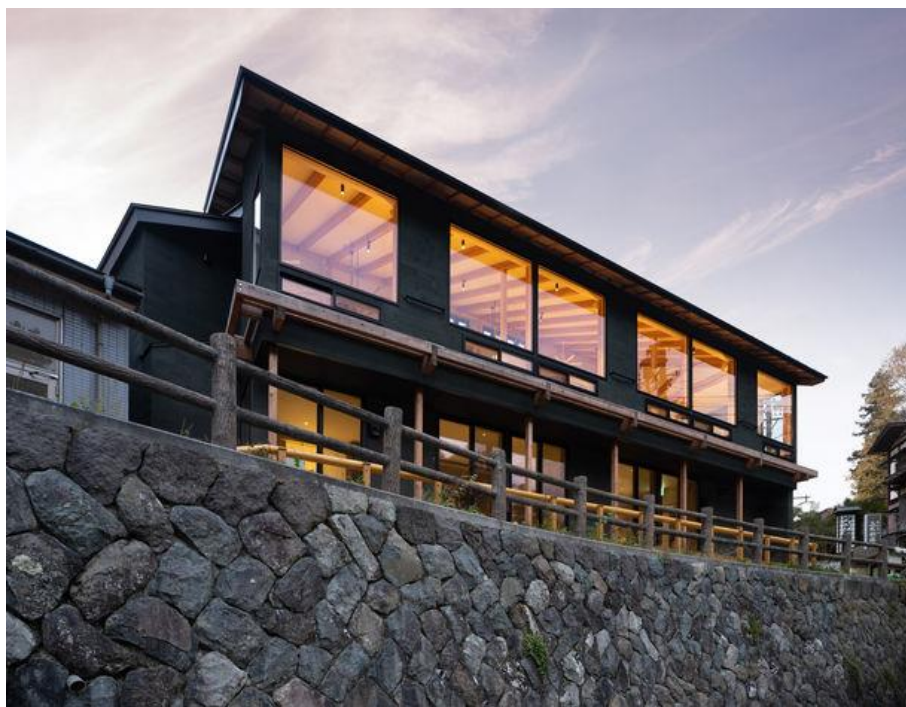
Restaurant 溪 外観