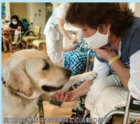
国立病院機構 宇都宮病院での活動の様子