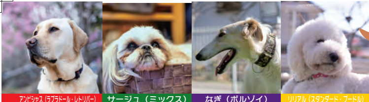
アンビヤス (ラブラドル・レトリバー) サーージュ (ミックス) なぎ (ホルソイ) リリアル (スタンダード・プードル) エース (スタンダード・プードル) リヤン (トイ・プードル) マール (ラフ・コリー) リ汰 (秋田犬)