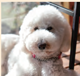
スタンダードプードルのグルーミングは2万円以上が相場といわれています。

「身体障がい者補助犬法 (補助犬法)」に守られている犬は「盲導犬」「介助犬」「聴導犬」だけです。医療機関や高齢者施設、障がい者施設などで活動している“セラピードッグ”の活動には「公的な支援」はありません。すべての活動は利用料や会員の会費、寄付で運営されています。