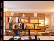
「THE SHINMONZEN」京都・祇園に感じる南仏プロヴァンス Jul 19, 2022