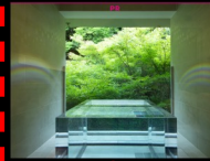
現代美術家・柳澤真・展覧会「すみや電報 薔」 永遠の旅人を迎える宿り Aug 7, 2022