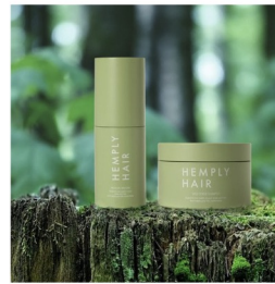
CBD 配合！ ウェルネスヘアケアブランド「HEMPLY HAIR」誕生 Nov 13, 2022 - STARRingU