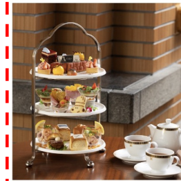
帝国ホテル 東京『PEANUTS』作者 チャールズ・M・シュルツ氏 生誕100周年記念企画 第2弾！ Nov 13, 2022 - STARRingU