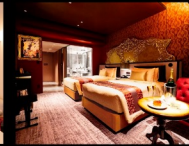
「オペラ座の怪人」コンセプトルーム 魅惑の世界 May 29, 2022