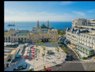
モナコ公国 レスポンシブル・ラグジュアリー Oct 25, 2022