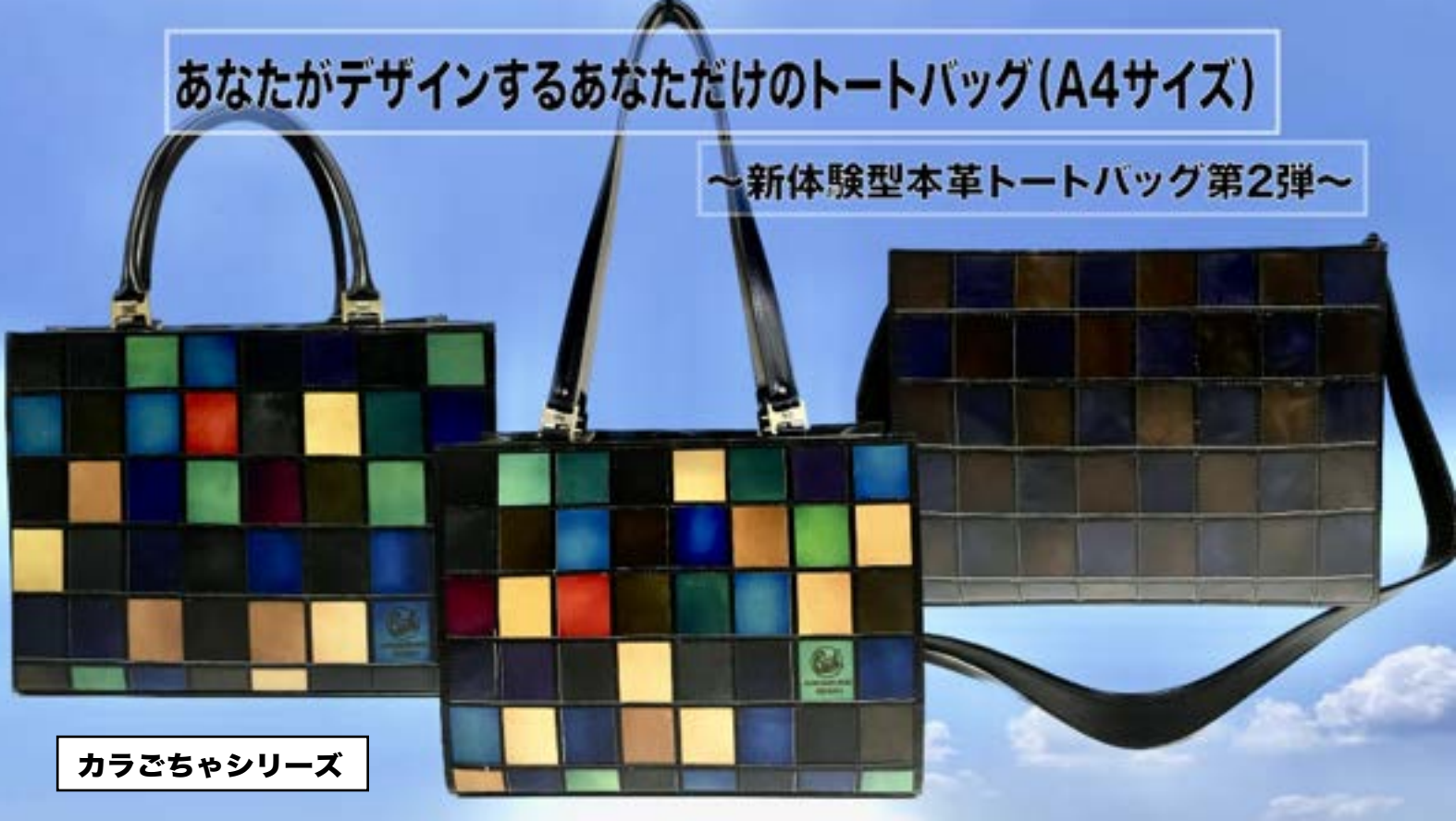
カラごちゃシリーズ