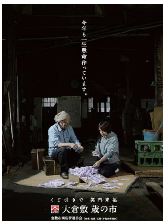
倉庫らしき場所で抽選会の「三角くじ」を準備する 2 人は