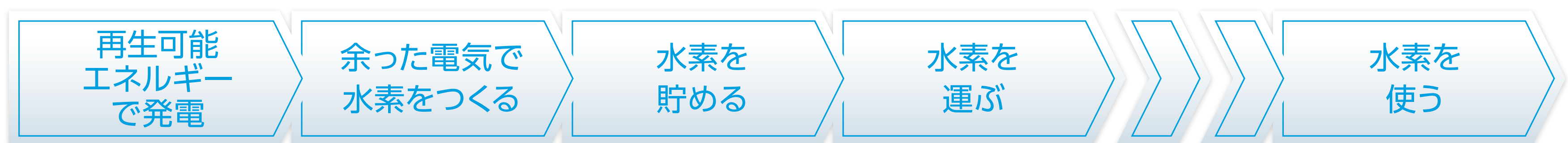
▶グリーントランスフォーメーション(GX)のイメージ

I-PEXグループでは、沖縄県を中心に 「最・先端」なカーボンフリー社会を目指した 研究開発活動を行っています。