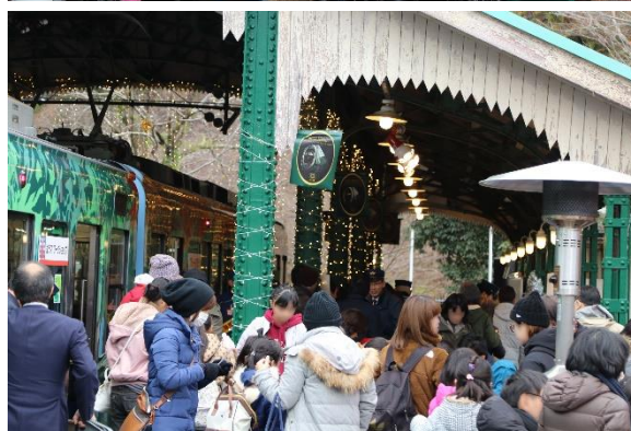
過去の開催時のようす