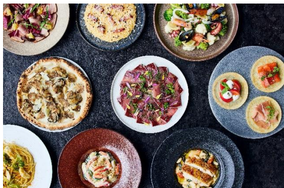
自慢のイタリアンbuffet

大丸東京最上階に位置するXEX TOKYO。大きな窓から東京の景色を一望しながら自慢のランチbuffetをお楽しみいただくことができます。入り口を抜けると約50種類のイタリアンbuffetや見た目から可愛いスイーツ達がお出迎え。冬の旬な食材を使用したシェフイチオシの「牡蠣とトリュフ、カリフラワー・クレマのピッツァビアンカ」やイタリアンには欠かせない、カルボナーラとリゾットが合わさった「トリュフ香るカルボナーラリゾット」など、自慢のラインナップをご用意いたしました。