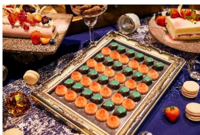
宝石ボンボンショコラ