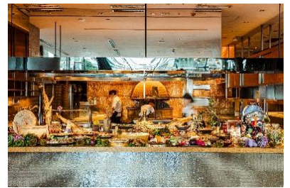
LIVE感溢れるオープンキッチン