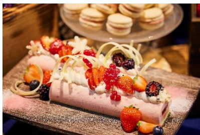
苺のレアチーズケーキ