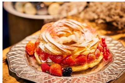
ホワイトパリプレスト