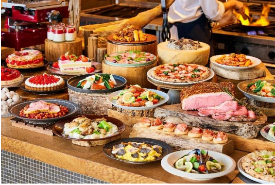
オープンキッチンに並ぶ華やかなブッフェ

ワンフロア約890㎡を独占する「XEX 日本橋」。店内は大きな窓ガラスに囲まれた開放的な空間で、シェフ達の姿が見えるオープンキッチンが魅力の一つ。そこに並ぶ料理やスイーツ達は味はもちろん、華やかな見た目でも愉ませてくれます。シェフおすすめの少しの塩気と触感がたまらない「自家製サルシッチャと芽キャベツのピッツァ」や、XEXのブッフェには欠かせない「ローストビーフ」はトリュフとモッツァレラチーズのXEX 日本橋オリジナルのソースをご用意いたしました。