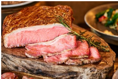
ローストビーフ トリュフとモッツァレラのチーズソース

ワンフロア約890㎡を独占する「XEX 日本橋」。店内は大きな窓ガラスに囲まれた開放的な空間で、シェフ達の姿が見えるオープンキッチンが魅力の一つ。そこに並ぶ料理やスイーツ達は味はもちろん、華やかな見た目でも愉ませてくれます。シェフおすすめの少しの塩気と触感がたまらない「自家製サルシッチャと芽キャベツのピッツァ」や、XEXのブッフェには欠かせない「ローストビーフ」はトリュフとモッツァレラチーズのXEX 日本橋オリジナルのソースをご用意いたしました。