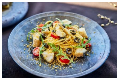
真鯛とカラスミのスパゲッティ