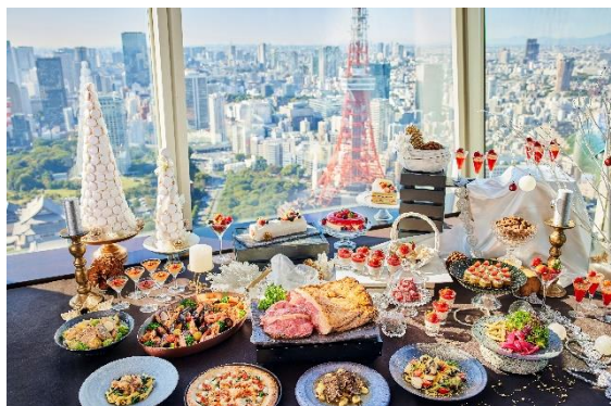
ビル最上階からの絶景と楽しむbuffetの数々

XEX ATAGO GREEN HILLSのシェフが腕をふるい、冬の食材をふんだんに使用した料理の数々は絶品ばかり。味わい深いカラスミを使用した「真鯛とカラスミのスパゲッティ」やこの季節だからこそ楽しむことのできる「ズワイ蟹と冬野菜のピッツァ」「牡蠣と法蓮草のクリームソースパスタ」など、心も体も温まるラインナップをご用意いたしました。