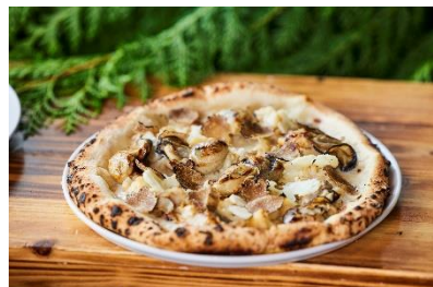
牡蠣とトリュフ、カリフラワー・クレマの ピッツァビアンカ

大丸東京最上階に位置するXEX TOKYO。大きな窓から東京の景色を一望しながら自慢のランチbuffetをお楽しみいただくことができます。入り口を抜けると約50種類のイタリアンbuffetや見た目から可愛いスイーツ達がお出迎え。冬の旬な食材を使用したシェフイチオシの「牡蠣とトリュフ、カリフラワー・クレマのピッツァビアンカ」やイタリアンには欠かせない、カルボナーラとリゾットが合わさった「トリュフ香るカルボナーラリゾット」など、自慢のラインナップをご用意いたしました。