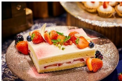
苺のショートケーキ