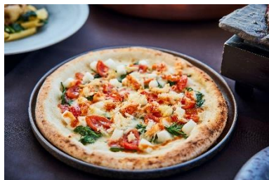
ズワイ蟹と冬野菜のピッツァ