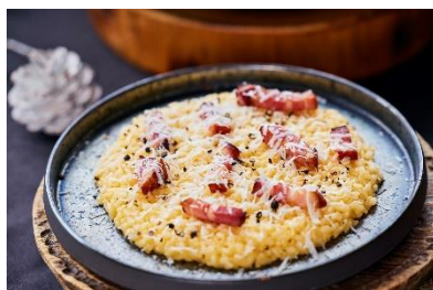
トリュフ香るカルボナーラリゾット