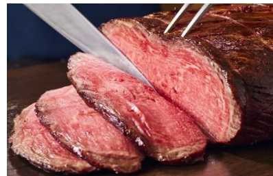
大人気！ 絶品ローストビーフ トリュフソース

【 XEX ATAGO GREEN HILLS 】 所在地: 〒105-6242 東京都港区愛宕2-5-1 MORIタワー42F 電話番号: 03-5777-0065 / ランチタイム: 11:30~15:00 (最終入店 14:00) 5,800円(税込サ別) ※90分制となります