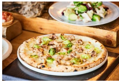
自家製サルシッチャと芽キャベツのピッツァ