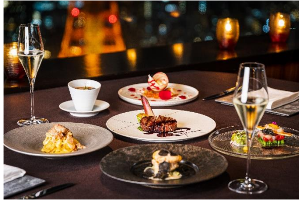
XEX ATAGO GREEN HILLS / Salvatore Cuomo Bros. クリスマスディナーコース