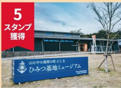
ミュージアムエントランス