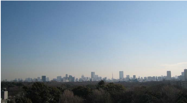
【14階からの眺望 2013年2月撮影】

地上14階建ての「ガーラ・プレシヤス代々木上原」は、周辺では一際目を引くタワーフォルムが特徴です。最上階からは、明治神宮、代々木公園を眼下に、丸の内、六本木方面まで見渡せる眺望が広がります。