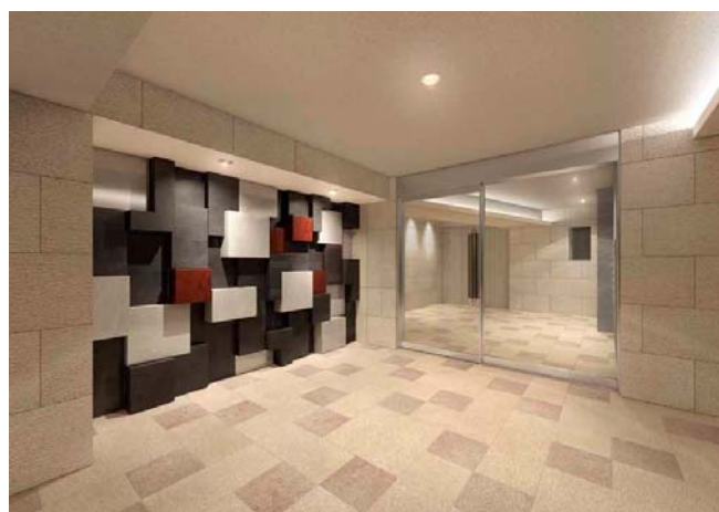
<エントランスホールイメージ>