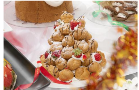
クロカンブッシュ