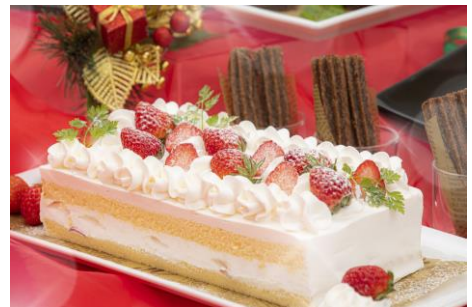
苺のショートケーキ