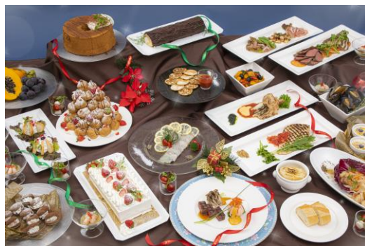
ディナービュッフェ料理(イメージ)