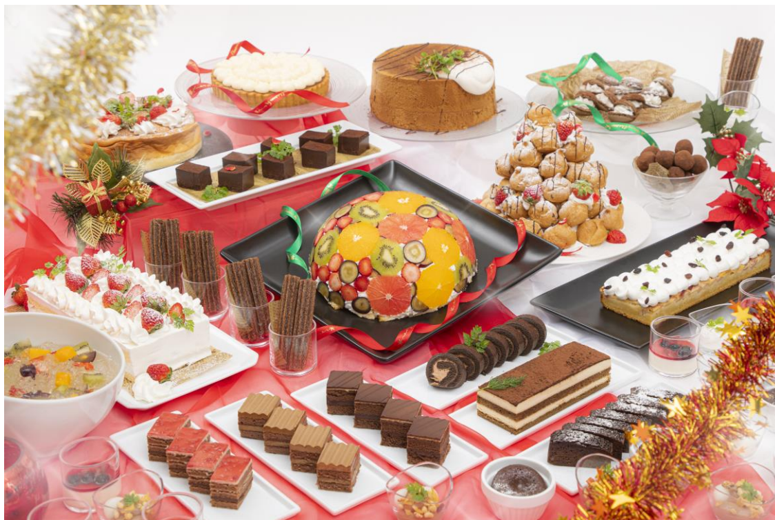
スイーツビュッフェメニュー(イメージ)

クリスマスツリーやリースなど華やかに装飾を施した店内でご家族やご友人と心ゆくまでご堪能ください。