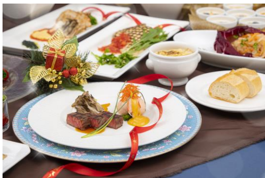
メイン料理(イメージ)