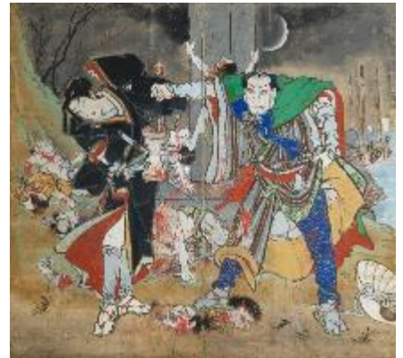
浮世柄比翼稲妻 鈴ヶ森 二曲一隻屏風 紙本彩色 香南市赤岡町本町一区蔵