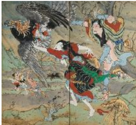
花衣いろは縁起 鷲の段 二曲一隻屏風 紙本彩色 香南市赤岡町本町二区蔵