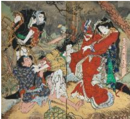
伊達競阿国戯場 累 二曲一隻屏風 紙本彩色 香南市赤岡町本町二区蔵

本展は、高知県外では約50年ぶりの大規模展です。幕末の土佐に生き、異彩を放つ屏風絵・絵馬提灯などを残した「絵金」の類稀なる個性と、その魅力について、代表作の数々で紹介합니다。