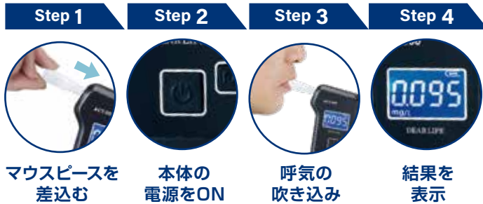
Step 1 マウスピースを 差し込む

マウスピースを差し込み本体の電源を入れて呼気を吹き込んでください。測定回数は約50000回です。