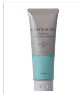
しっとりモイストタイプ