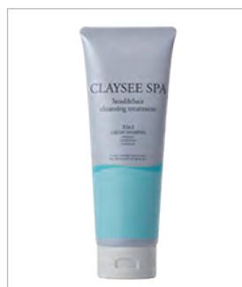
さらさらクールタイプ (メントール配合)