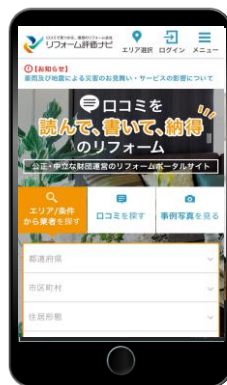
<TOPページ> (スマホサイト)