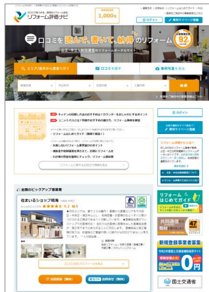
<TOPページ> (パソコンサイト)

サイトには、消費者が安心してリフォームができるよう、リフォーム事業者に関する情報だけでなく、リフォームの基礎知識や行政関連制度に関する情報も、わかりやすい動画も活用しながら豊富に掲載しています。