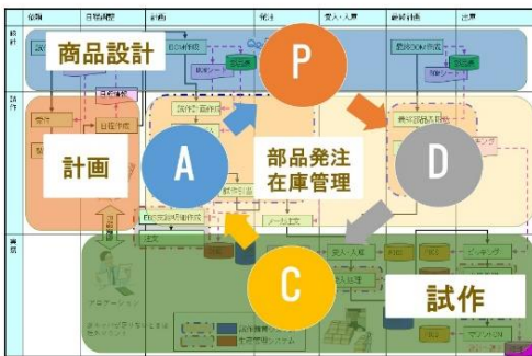
業務ワークフロー