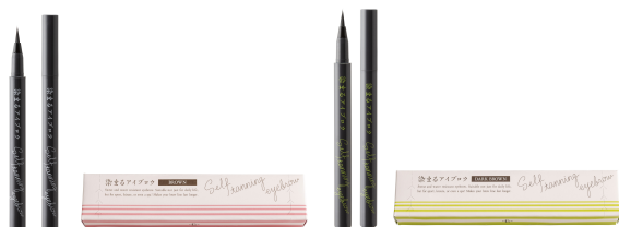
染まるアイブロウ <眉墨> 全2色 各2,420円(税込)