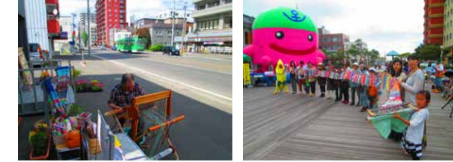
札幌の町中で織りつなぎ 門司港レトロで織りつなぎ