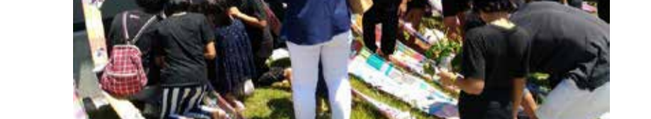
国際津波ミュージアム(タイ王国・バンガー県)にて 震災遺構にさをり織りを飾り付けて東日本大震災慰霊式典を行う