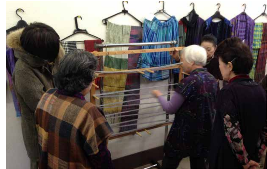
2013年12月4日 東日本大震災1000日目 宮古市内にて プロジェクトスタート