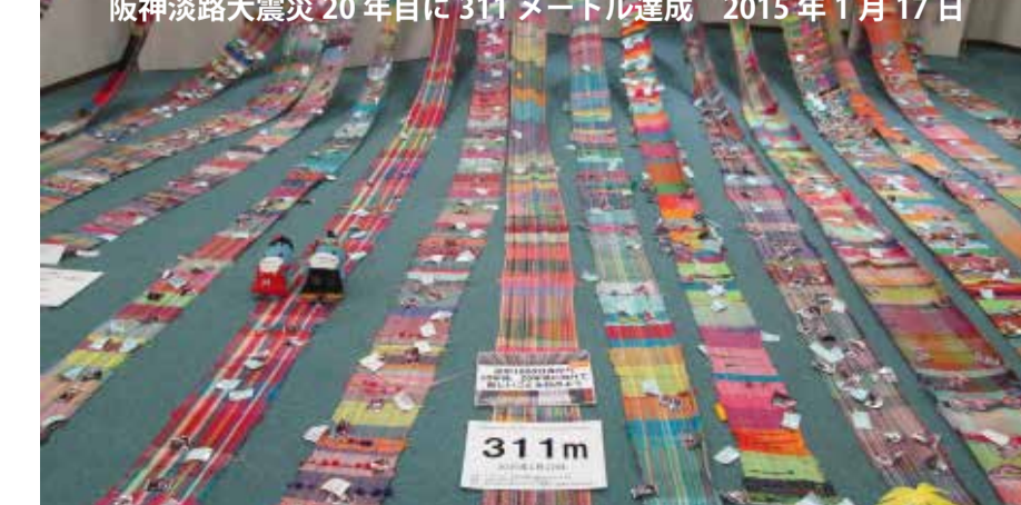
阪神淡路大震災20年目に311メートル達成 2015年1月17日 311m