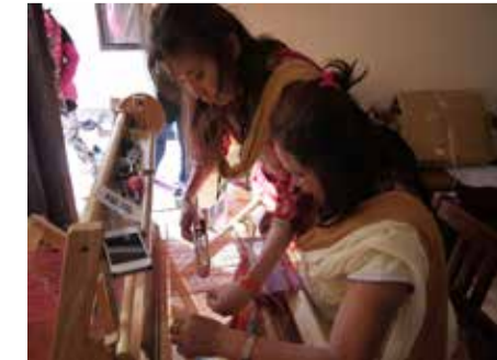
ネパールでの織りつなぎ カトマンドゥのシャクティサムハにて