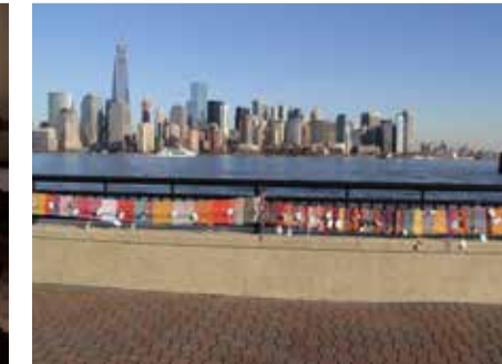
ニューヨークで織りつなぎをした布を 街が一望できる公園に飾り付けた