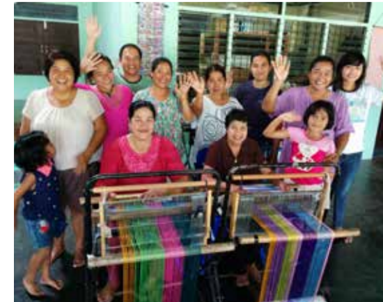
タイ王国バンガー県 タクアハ郡バンナムアン さをりトレーニングセンター タイの津波被災者たちにより たて糸張り作業が終了