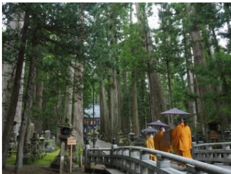
しょうじんく 奥之院 生身供