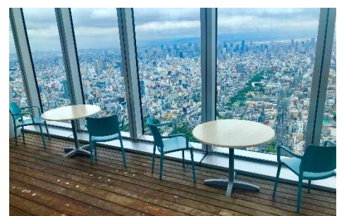
“ととのう”外気浴（イメージ）