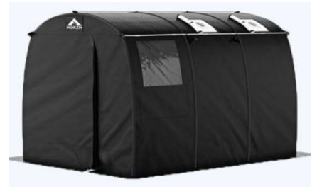
サウナ用テント（イメージ）