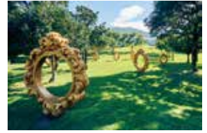
《あなたこそアート》2000