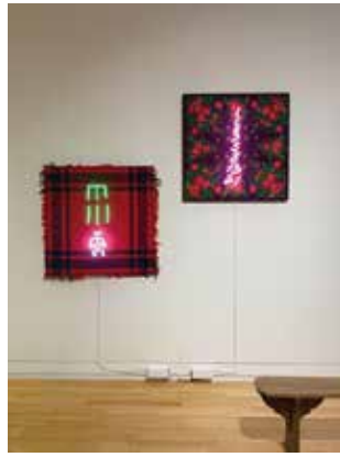
《Your Bright Future》2020

そのような状況にあって、チェは韓国や鹿児島で収集した日常の事物から着想を得て非日常的な作品へと昇華させた新作に加え、「人類世」や「相利共生」の視点に着目したインスタレーションなどを展示します。ここでしか見ることのできないチェ独自の輝くような美しさを味わうものとなるでしょう。