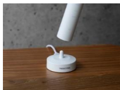
充電台に置くだけの 手軽な無接点充電式