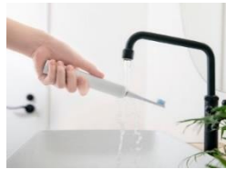
IPX7防水性能で、 本体も丸洗い可能。 清潔な状態を保てます。