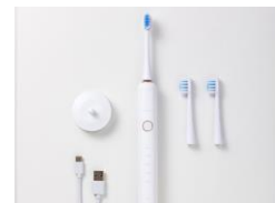
セット内容 本体、ブラシセット×3個、 充電台、充電ケーブル