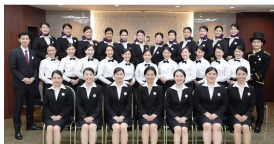
11代目カフェ・ラポールスタッフ(昨年)