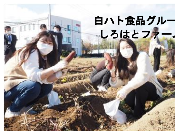
白ハト食品グループ しろはとファーム