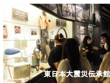
東日本大震災伝承館