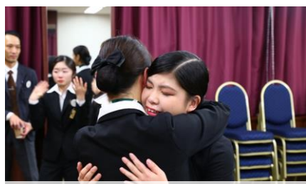
本番終了後、達成感に仲間と涙

昨年度はコロナ禍で思い通りに進まず、困難だらけでした。ただ、そんな時に出来ない事に捉われるのではなく、何が出来るかを考え、11代目全員で行動しました。営業当日、いきいきと笑顔で働いている11代目の仲間の姿を見た時や、沢山のお客様で一杯になっているカフェ内を見た時は、皆と一丸になって乗り越えることが出来て本当に良かった、と心底嬉しい気持ちになりました。10年間先輩が繋いでくれたカフェ・ラポールを、私達11代目として、12代目の後輩に繋げられる事を誇りに思います。仲間と共に感じた達成感は、私にとって一生の宝物です。