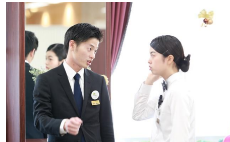
ときに仲間とぶつかりあう事も...