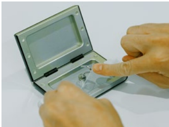
①糸結び(結紮) Surgical Knot Tying