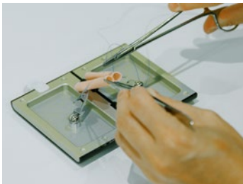
④腸管縫合 Intestinal sutures of infant