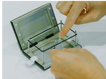
②深部を想定糸結び(結紮) Surgical Knot Tying for deep area