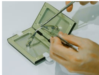
⑤血管縫合 Vascular Anastomosis