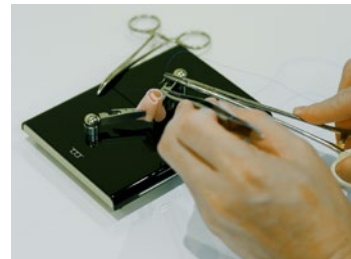
⑥腸管縫合(外面使用) Intestinal sutures: Outer Use