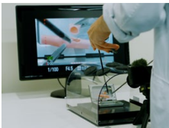
⑦腹腔鏡下肝管空腸吻合 Laparoscopic Hepaticojejunal anastomosis