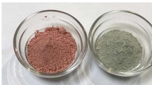
カオリン/レッドクレイ※8/グリーンクレイ※9 (フランス産 天然クレイ※7)

皮脂が酸化してできる過酸化脂質を吸着除去のために配合。 脂質・たんぱく質・臭いや汚れの吸着に期待できる。