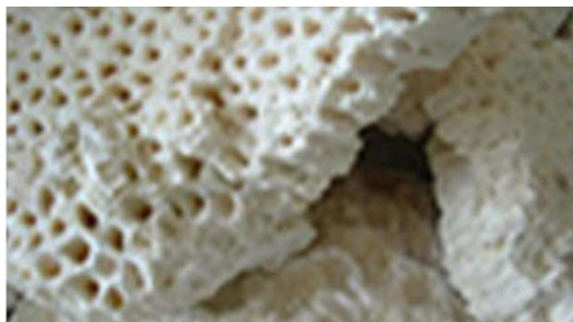
コーラルアパタイト (沖縄与那国产 天然化石サンゴ※6)

皮脂が酸化してできる過酸化脂質を吸着除去のために配合。 脂質・たんぱく質・臭いや汚れの吸着に期待できる。