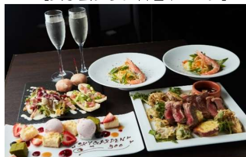
【ペアプラン料理イメージ】