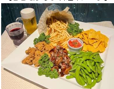
【グループわいわいプラン料理イメージ】