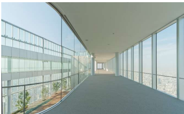
【屋内で快適鑑賞プランエリア】 ※窓側にパイプ椅子を3列、後ろに立見席を設置