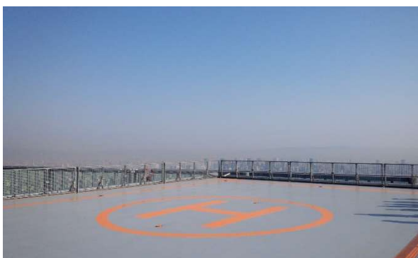
【最頂部で鑑賞する贅沢プランエリア】 ※ハルカスの最頂部から立見でのご鑑賞