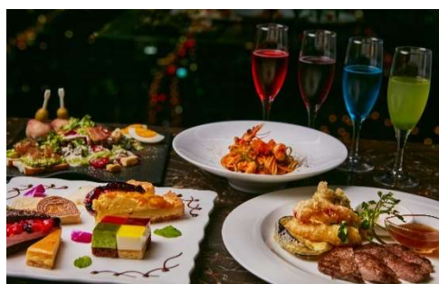
【女子会プラン料理イメージ】