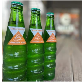
特典のジンジャービール☆