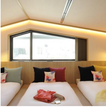
3人で泊まれるお部屋