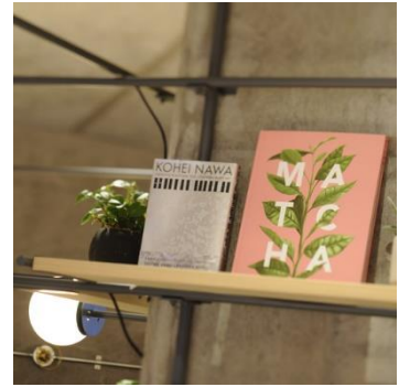
1階カフェスペースも利用可能