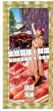
商売繁盛・金運 (笠間稲荷神社 × 常陸牛)