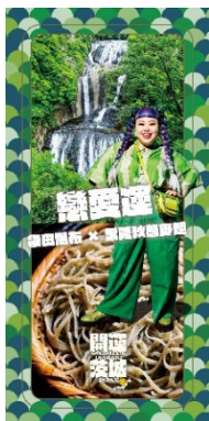
恋愛運 (袋田の滝 × 常陸秋そば)