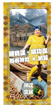
勝負運・成功運 (御岩神社 × 納豆)