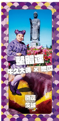
全体運 (牛久大仏 × かんしょ)

茨城県のパワースポット等と食を組み合わせた「開運茨城」の待ち受け画像をウェブサイトからダウンロードできます。茨城にはハッピーがあふれているというメッセージが込められており、待ち受けにすると運気が上がり、あなたにもハッピーが訪れるかも！