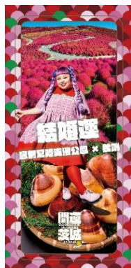
結婚運 (ひたち海浜公園 × はまぐり)