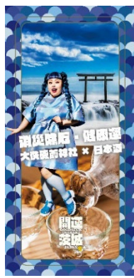
厄除け・健康運 (大洗磯前神社 × 日本酒)