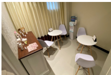
施術前にお体の様子を伺います