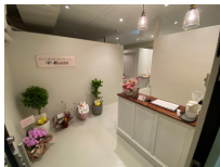
ビルは古いけど、内装はピカピカです