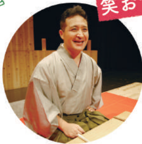
講談師 四代目 玉田玉秀齋氏

第2部 『おもしろおかしく、八幡市の歴史わくわく講談会』 14:30~15:20 講談師 四代目 玉田玉秀齋氏