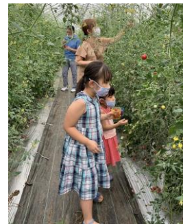
10,000円観光農園ファミリーチケット等