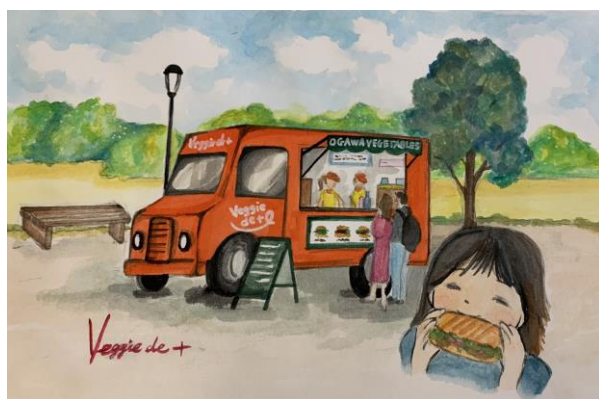
■キッチンカーイメージ

キッチンカーを使い、規格外野菜をサラダ、スムージー、ホットサンドなどに生まれ変え「フードロスの解消」に取り組みます。また、イベントの出店はもちろん、自社観光農園での併設や、地域へ出向き、新たなコミュニティの創出も目指していきます。