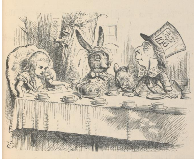
マッド・ハッターのお茶会でのアリス、『不思議の国のアリス』初刊行版本より、 ジョン・テニエル画、1866年、V&A内ナショナル・アート図書館蔵

開 催 趣 旨：ルイス・キャロルの『不思議の国のアリス』は、1865年に初版本が発行されて以来、今もなお世界中の人々を魅了し続けています。本展は、英国ヴィクトリア・アンド・アルバート博物館(V&A)発の国際巡回展です。ジョン・テニエルの貴重な原画をはじめ、物語をモチーフにした映画やデザイン、舞台やファッションなど、約300点の作品をとおして、150年以上の長きにわたり愛され続ける『不思議の国のアリス』の魅力を紐解きます。