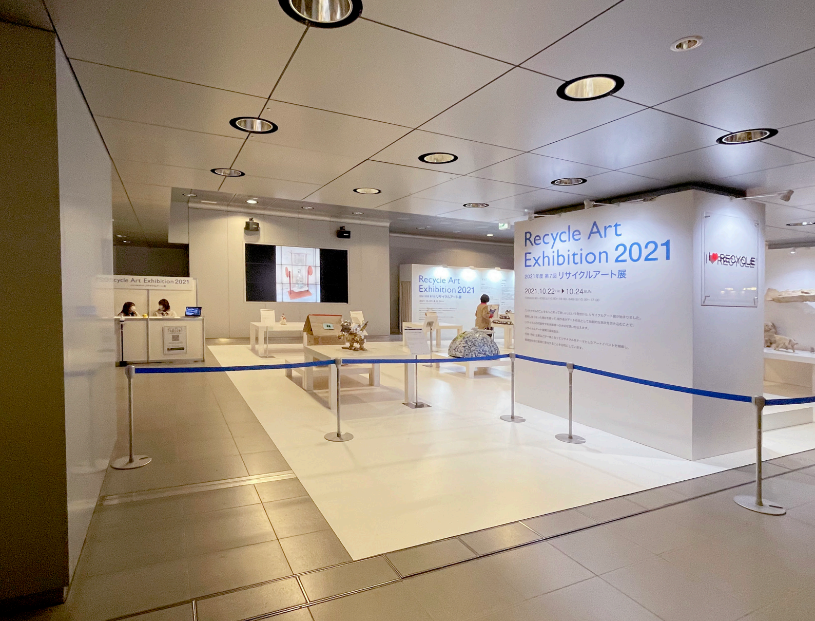
△ 第7回リサイクルアート展